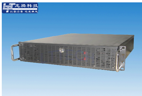
龙腾科技有限公司 http://www.lttech.cn 电话:86-755-89671906,81152976